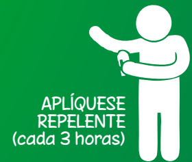
APLÍQUESE REPELENTE (cada 3 horas)