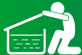
TAPE LOS CONTENEDORES DE AGUA