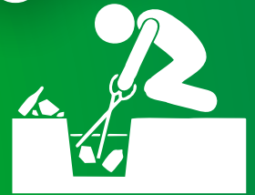
ELIMINE LOS CRIADEROS DE MOSQUITOS